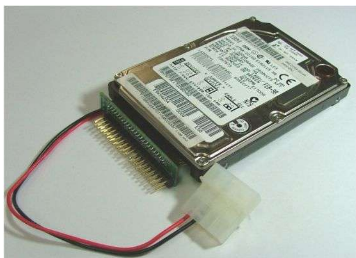
取り付けイメージ