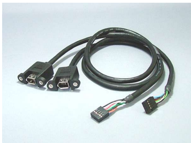
RCH1394MB ケーブル長 60cm

誤った接続をした場合、マザーボードあるいは接続した周辺機器を損傷するおそれがあります。