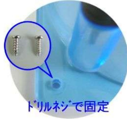
ドリルネジで固定

② CPU用ヒートシンクの上にエアインターカーを乗せ、ドリルネジで固定します。ネジがヒートシンクのフィン間に入るように位置を調整します。ネジは付属ネジの中から適切な径のものをお選びください。