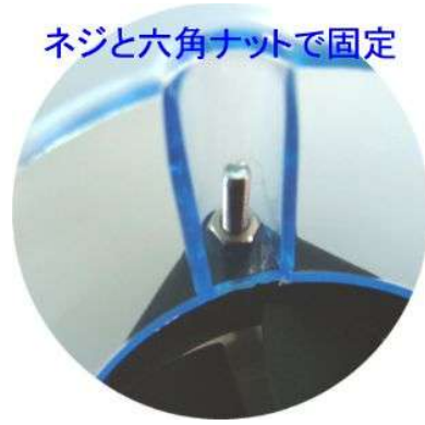
ネジと六角ナットで固定

② CPU用ヒートシンクの上にエアインターカーを乗せ、ドリルネジで固定します。ネジがヒートシンクのフィン間に入るように位置を調整します。ネジは付属ネジの中から適切な径のものをお選びください。