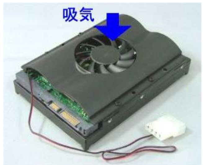
取り付けイメージ