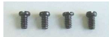
取り付けネジ(インチネジ) 4個