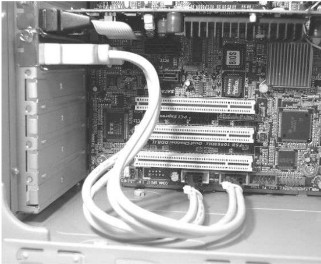
パソコン内部取り付けイメージ