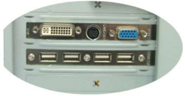
パソコン背面の装着イメージ(下段:本製品)