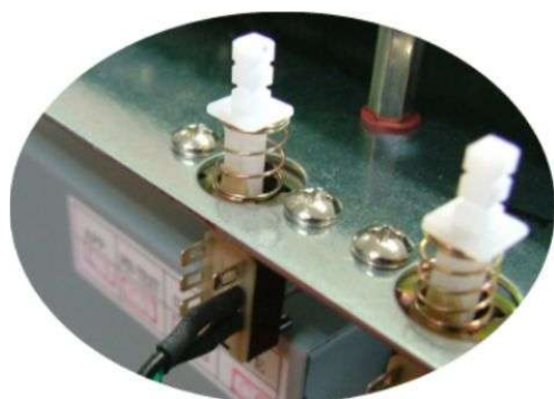
取り付けイメージ

ご注意 コネクタのピン配列はご使用のマザーボード マニュアルを参照してください。