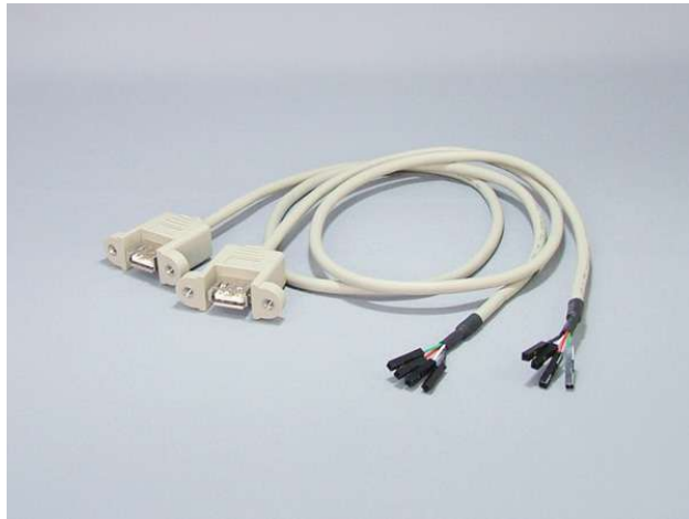
RUSB04 ケーブル長 60cm

誤った接続をした場合、マザーボードあるいは接続した周辺機器を損傷するおそれがあります。