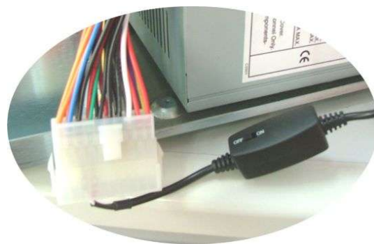
増設電源に接続した周辺機器